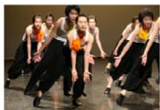
在舞台上學習 舞蹈藝術