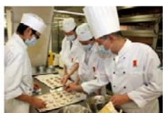
在廚房學習 西式食品製作