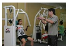
在健身中心學習 運動管理與教練法