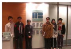
在證監會學習 認識金融服務