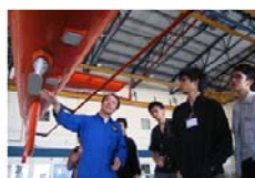
不是紙上談兵 航空學