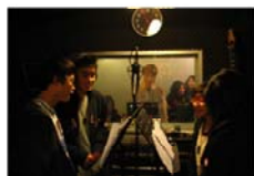
在錄音室學習 電台主持與節目製作